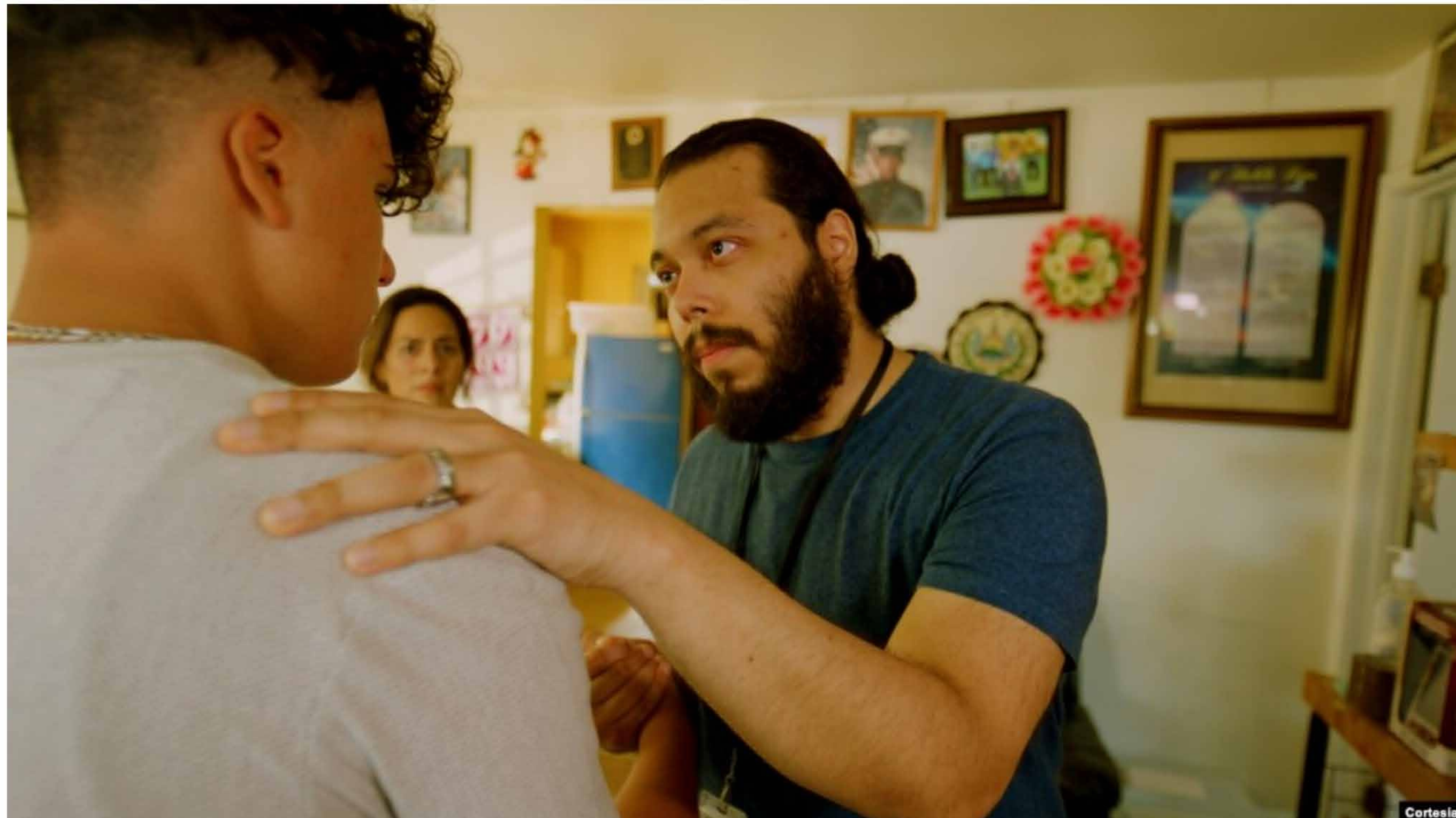
Fotograma de secuencia de film "These Days" que aborda el tema de la migración salvadoreña en Long Island, Nueva York y los conflictos de identidad en la familia.

La película “These Days” cuenta la historia de familias en una comunidad inmigrante de mayoría salvadoreña en Long Island, Nueva York. El filme, catalogado como docu-ficción, muestra los retos que plantea la integración, el trabajo y los traumas que se arrastran al emigrar.