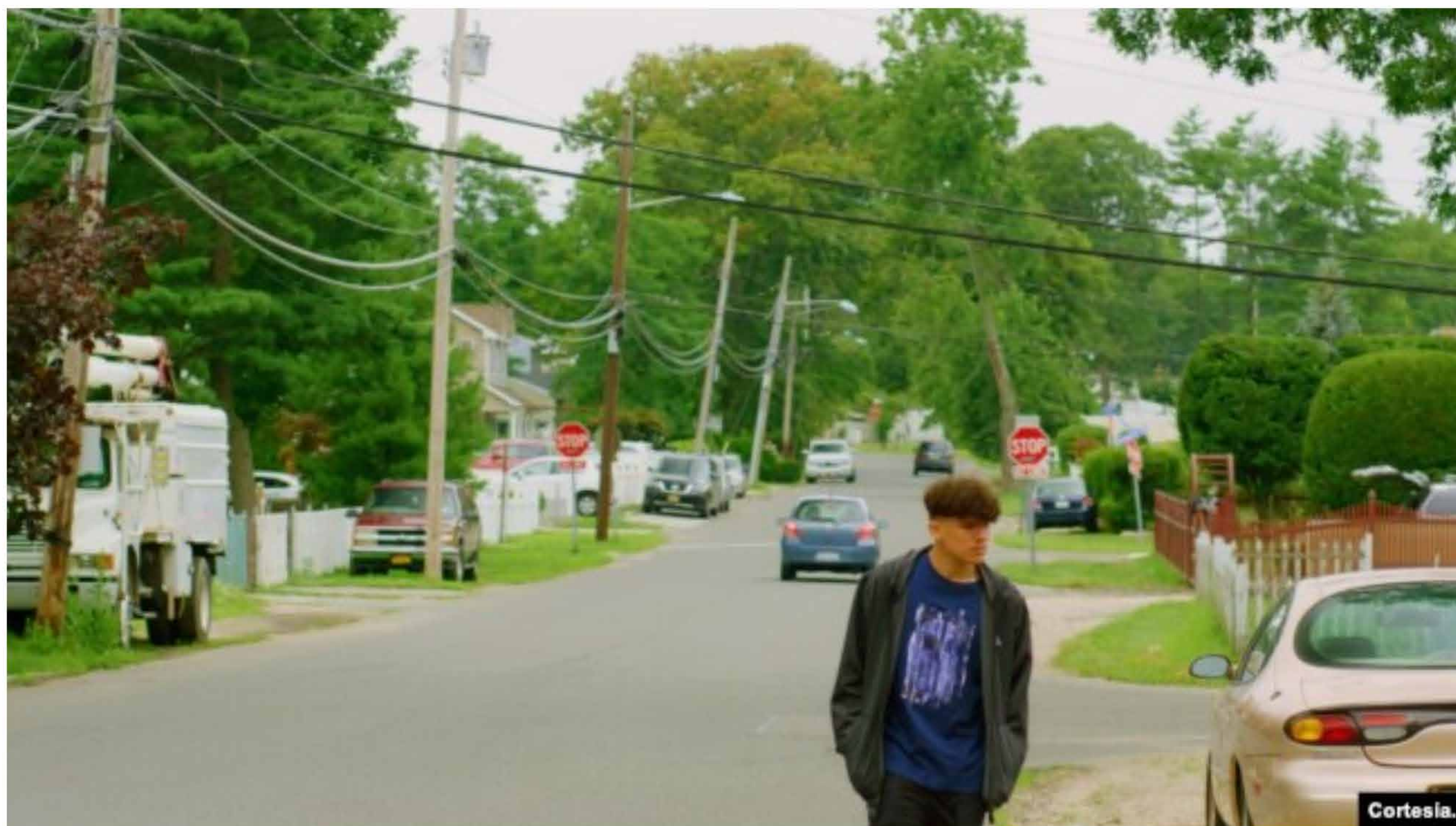
Este fotograma de “These Day” muestra un vecindario en Brentwood, Long Island, en las afueras de la ciudad de Nueva York, donde habitan en su mayoría inmigrantes salvadoreños.

“Me siento muy representado en la película porque al igual que “Jay” yo también pasé por esas experiencias”, dice al referirse a cómo los hijos de inmigrantes nacidos en EEUU tienen que afrontar con varios retos para encontrar su propia identidad, y que esos conflictos incluso pueden llevar a caminos negativos como las pandillas, de los que la película abre una arista para el debate.